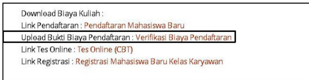
Gambar 6. Menu Verifikasi Biaya Pendaftaran

Untuk Kelas Karyawan setelah melakukan pembayaran langkah selanjutnya silahkan upload bukti biaya pendaftaran sebelum melakukan Tes CBT. Tampilan menu untuk upload bukti pembayaran dan Tes CBT seperti di bawah. Hasil Tes akan dikirim melalui E-Mail.