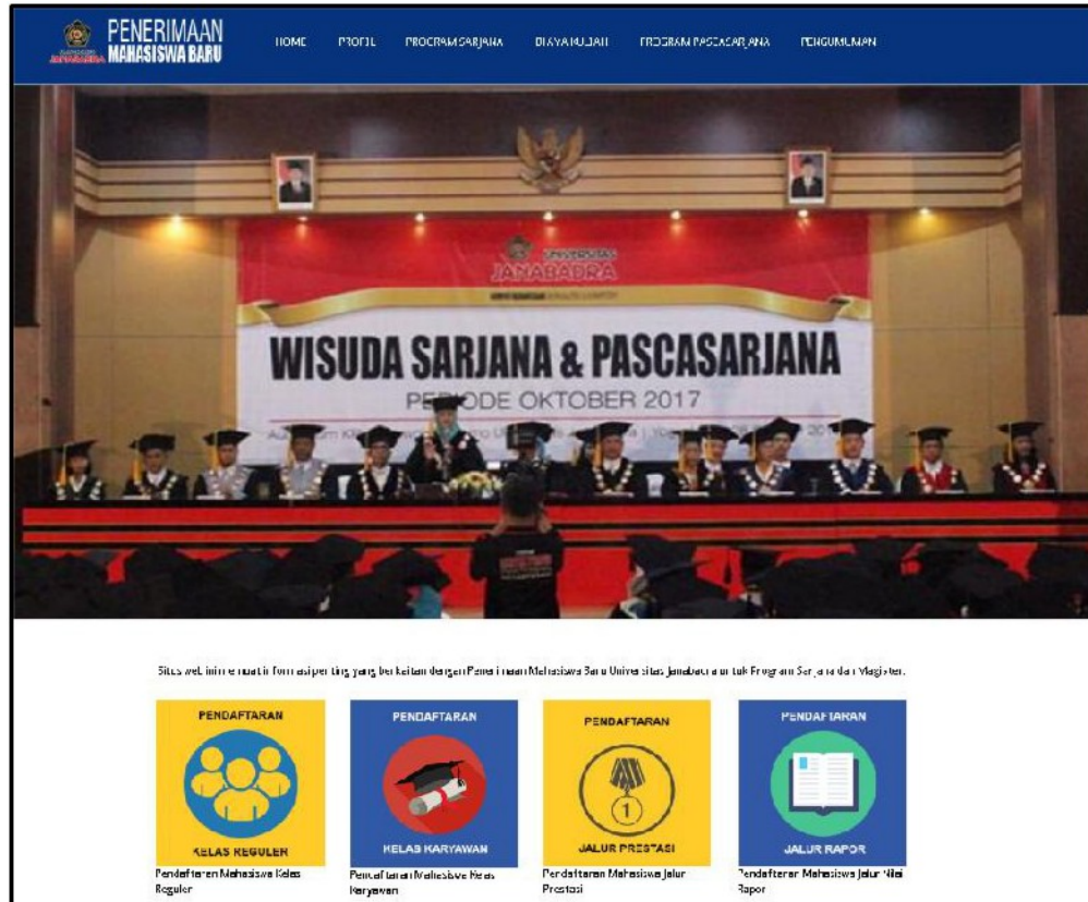
Gambar 1. Halaman utama pmb.janabadra.ac.id