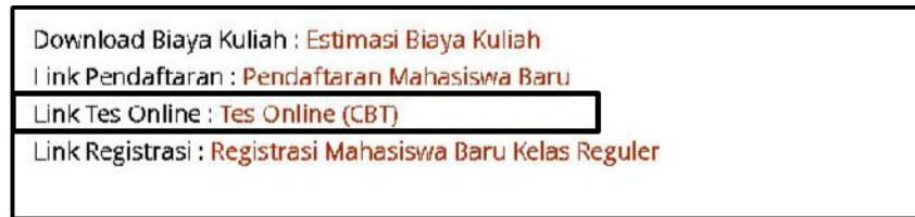
Gambar 5. Menu Tes Online CBT

Untuk Kelas Karyawan setelah melakukan pembayaran langkah selanjutnya silahkan upload bukti biaya pendaftaran sebelum melakukan Tes CBT. Tampilan menu untuk upload bukti pembayaran dan Tes CBT seperti di bawah. Hasil Tes akan dikirim melalui E-Mail.