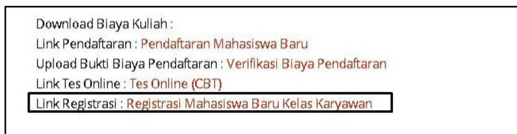
Gambar 7. Menu Registrasi Mahasiswa Baru

Untuk Calon Mahasiswa yang sudah dinyatakan diterima dan melakukan pembayaran Heregistrasi, silahkan mengisi Form Registrasi pada menu Registrasi seperti pada contoh gambar 7.